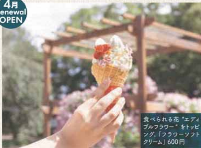
食べられる花「エディブルフラワー」をトッピング。「フラワーソフトクリーム」600円

来園の記念や思い出に残る楽しいグッズがズラリ。季節の植物や苗木、人気の多肉植物なども揃うほか、お弁当や軽食も充実!