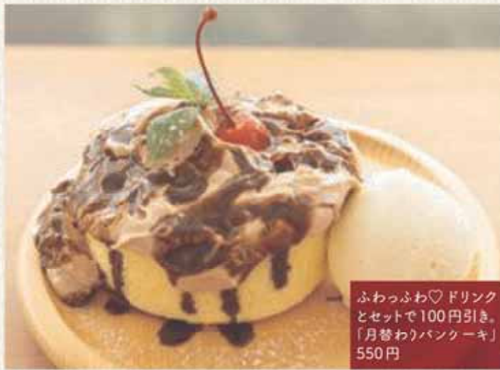
ふわふわ♡ドリンクとセットで100円引き。「月替わりパンケーキ」550円